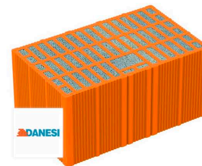
Normablok NORMABLOK PIÙ S40 MA